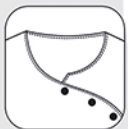
Encolure fantaisie asymétrique