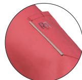
Poche plaquée stylo sur manche avec liseré Pen patch pocket on sleeve with edging

Scannez et visualisez (info P.8) Scan and visualize